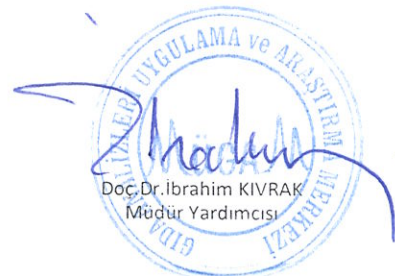
Doç.Dr.İbrahim KIVRAK Müdür Yardımcısı

Tüm hakları saklıdır. Online olarak da dahil olmak üzere MUGAM'ın yazılı izni olmaksızın yayımlanması, kopyalanması, kullanımı, yayılması veya dağıtımı kesinlikle yasaktır.